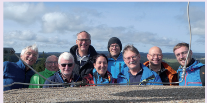
Faustballer-Ausflug: auf dem Stöcklewaldturm bei Schonach,

Freitag - Sonntag, 26. - 28.09.: Traditioneller Faustballer-Ausflug (60. Ausflug in ununterbrochener Folge seit 1966 !) Diesesmal wird Quartier bezogen in Zöblen im Tannheimer Tal,