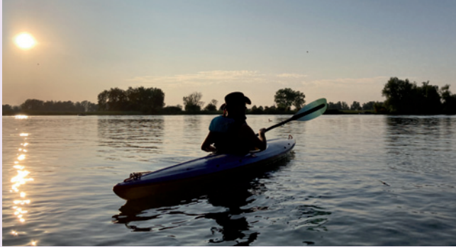
Nirgendwo anders: direkt vor unserem Vereinsheim - grandios

Donnerstag, 22.05., 19 Uhr: Vorstandssitzung