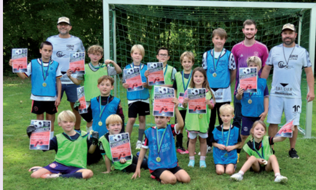
Medaillen und Urkunden für alle teilnehmenden Kids am Fußballtag

Pilates mit Vanessa: Donnerstags 18 - 19 Uhr: Der Kurs konzentriert sich auf die Stärkung der Körpermitte (Core), Flexibilität und Körperhaltung.