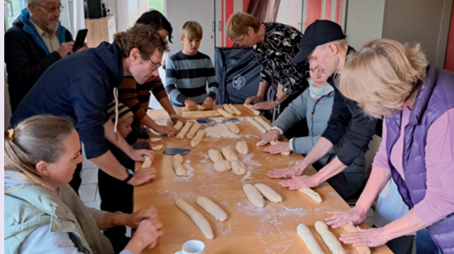
Back-Workshop: mit vereinten Kräften unter fachmännischer Anleitung.