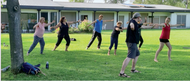
Tai Chi im Freien auf dem Vereinsgelände: sportlich und elegant.

Sonntag, 27.07.: Sommerhock: Brot und Spiele. Es gibt Spiele für Groß und Klein. Details folgen per Mail. Anmeldung bis 20.07., aber auch Kurzenschlossene sind herzlich willkommen!