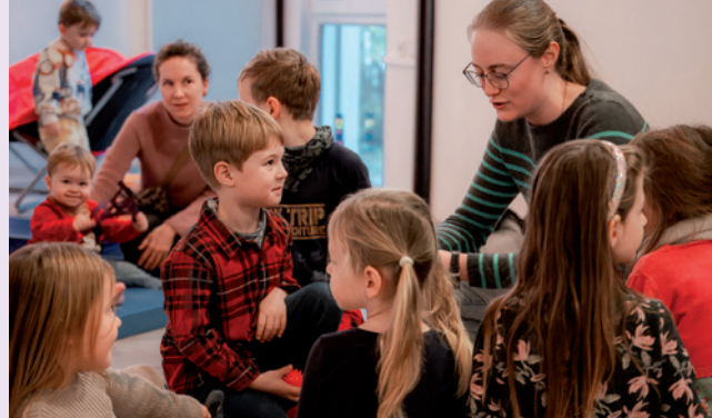
Aufmerksame Zuhörer bei der Weihnachtsgeschichte