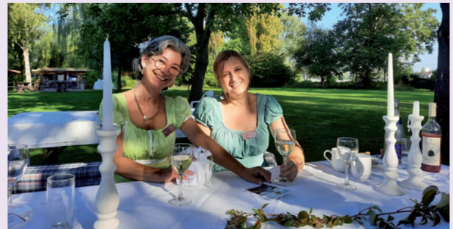
An einladend gedeckter Tafel: Sommerfest der Tanztaverne

Samstag, 26.07.: Sonnenuntergangsfahrt mit der historischen Fähre Konstanz. Weitere Infos folgen per Mail und an der Infotafel