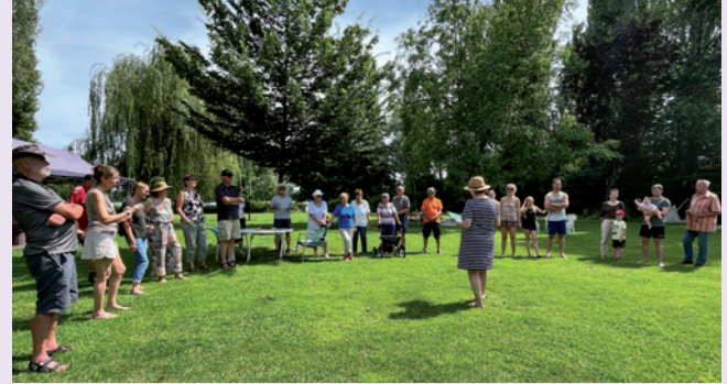
Begrüßung zu Brot und Spiele

Sonntag, 29.06.: Mammern-Schaffhausen-Tour, Paddeltour